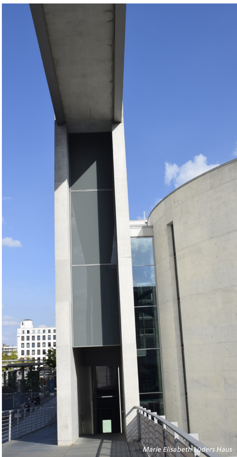
Marie Elisabeth Lüders Haus